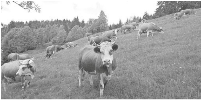
Weidfeld bei Aeule JM Henry: Lebensraum für vielerlei Arten bieten Weidflächen wie diese bei Schluchsee-Äule.

der Landwirtinnen und Landwirte, die es verstehen, ihre Wiesen und Weiden so zu bewirtschaften, dass diese als Lebensräume von Pflanzen und Tieren, aber auch zum Schutz des Grundwassers sowie in ihrer Funktion für Tourismus und Heimatidentität erhalten bleiben.