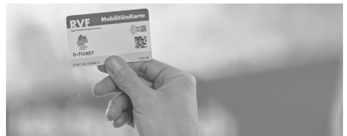
Deutschland-Ticket im RVF künftig auf Chipkarte

Die beim RVF „Mobilitätskarte“ genannte Chipkarte ist ab dem 1. März gültig und kann sofort zum Fahren verwendet werden. Eine Aktivierung oder ähnliches ist nicht nötig. Auf der Mobilitätskarte steht der Name des Abonnenten/der Abonnentin, eine Kartenummer und die Gültigkeit bzw. Laufzeit der Karte. Diese Nummer und die Kartenlaufzeit sind technische Vorgaben des Dienstleisters, der die Karten bespielt, und haben nichts mit der Abo-Nummer oder der Laufzeit des Abos zu tun. Bei einer Kontrolle wird die Gültigkeit des Abos ausgelesen. Wer über 21 Jahre alt ist, sollte einen Lichtbildausweis dabei haben und auf Verlangen vorzeigen können. Bei Fragen können sich Abonnentinnen und Abonnenten gern an das AboCenter der Freiburger Verkehrs AG (VAG) wenden. Dieses betreut die Deutschland-Tickets und RegioKarten-Abos im Auftrag des RVF.